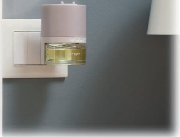
※画像は海外仕様のイメージ写真です。

手軽に、そして安全に香りを楽しむ。 「プラグインディフューザーアリア」 お好みの香りをお部屋にすばやく広げ、 ほのかな香りがやさしい空間を演出します。